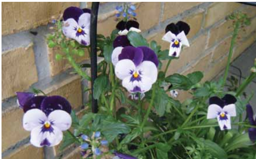
Atoqatigiinnikkummi inuunera taava qanoq?

Arnat aappaat aamma kajumissuseerussinnaasarpoq anniartitsinis-sarlu ersissutigineqartarluni. Atoqatigiinnissamut kajumissusee-runneq ataavartunngorsimappat, tamanna pillugu nakorsaq oqalo-qatigineqarsinnaavoq imaluunniit aappariit akornanni atoqatigiin-nikkut atugaqarnermut immikkut ilisimasalimmik ikiortissarsior-toqarsinnaavoq.