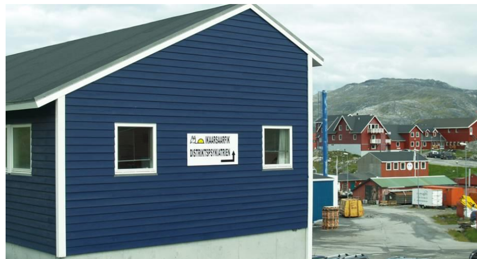
Niisi 5 – 7-imi inigut nutaat assingi aaku Billeder af vores nye lokaler på Niisi 5 -7